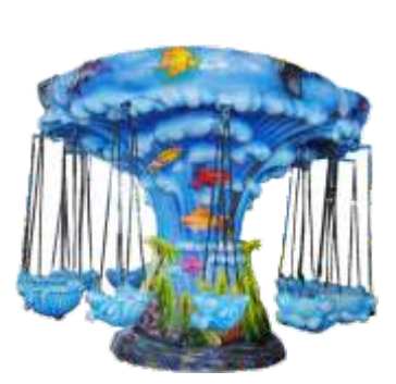
GS-QF841 Seaworld flying chair 海洋世界飞椅 适合年龄 功率 产品尺寸 包装尺寸 重量 For Age Power(W) Size(CM) Packing Size KG Children 2500 600*600*300 As package 950

适合年龄 功率 产品尺寸 包装尺寸 重量 For Age Power(W) Size(CM) Packing Size KG Children 400 140*140*160 150*150*170 120