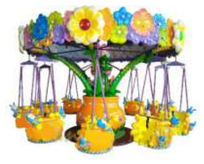
GS-QF807 Flower paradise 天堂花园 适合年龄功率产品尺寸包装尺寸重量 For Age Power(W) Size(CM) Packing Size KG Children 2500 600*600*280 As package 950

适合年龄功率产品尺寸包装尺寸重量 For Age Power(W) Size(CM) Packing Size KG Children 1100 600*600*220 As package 800