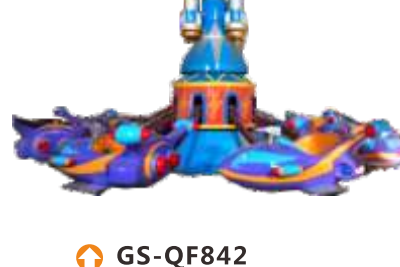
GS-QF842 Automatic aircraft 自控飞机 适合年龄功率产品尺寸包装尺寸重量 For Age Power(W) Size(CM) Packing Size KG Children 1500 860*860*550 870*870*560 5500